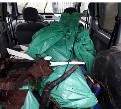
APRÈS-MIDI « NETTOYONS LA NATURE » POUR L'ÉCOLE DE SAINT ANDRÉ DE BOËGE