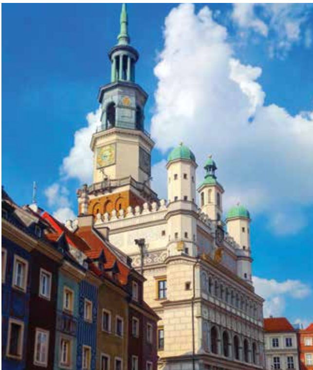
Stary Rinek - Centre-ville historique de Poznań

De plus en plus de jeunes étudiants profitent aujourd'hui de la possibilité de partir étudier à l'étranger grâce au programme Erasmus. En effet, la plupart des établissements français entretiennent des accords avec d'autres écoles dans les différents pays de l'Union Européenne. Pour faciliter cet échange, il est possible d'obtenir des bourses afin d'être aidé financièrement une fois sur place (bourse Erasmus et région Auvergne Rhône-Alpes) dont les montants sont déterminés en fonction du coût de la vie dans le pays d'accueil.