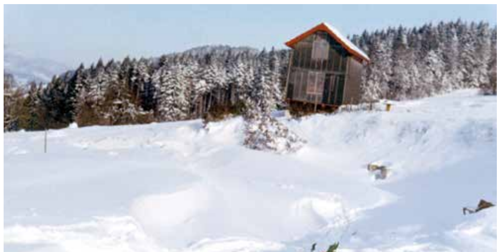
Janvier 1971 : de belles congères (chalet Frarin) ferment la route de Ludran