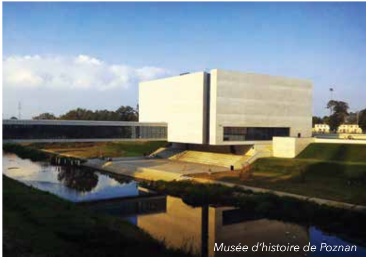
Musée d'histoire de Poznań