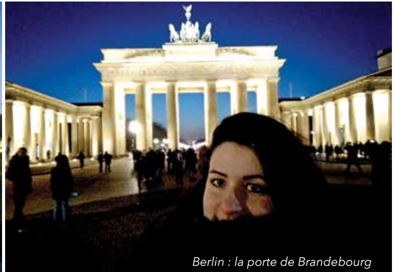
Berlin : la porte de Brandebourg