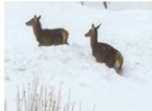
Songeur, je regarde et je me sens épris, Devant cette blancheur radieuse, infinie... (C. Garnier 1918)