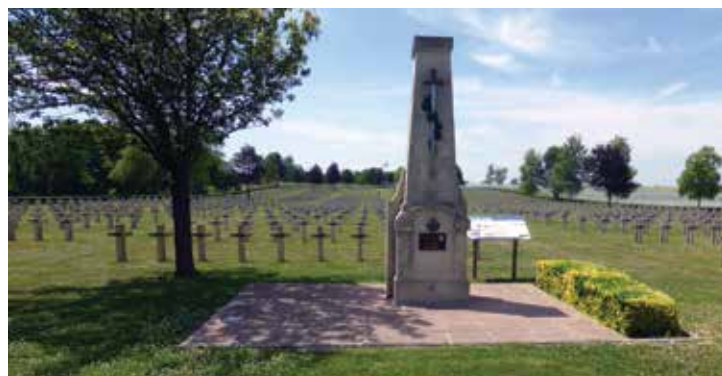
Nécropole nationale de Jonchery sur Suippe.