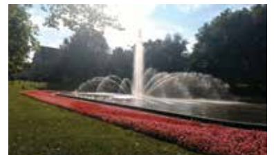
Fontaine de l'opéra de Poznań