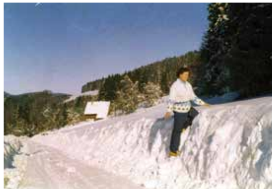
Février 1980 : route de Ludran 1,20 m de neige